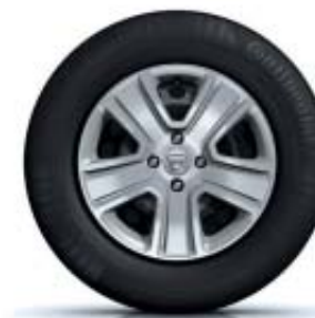
ENJOLIVEURS 15" POPSTER*