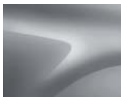
GRIS HIGHLAND (2)