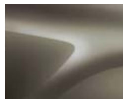
BEIGE DUNE (2)