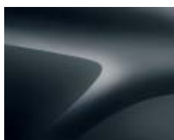
GRIS COMÈTE (2)