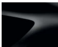
NOIR NACRÉ (2)