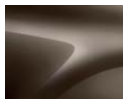
BRUN VISON (2)