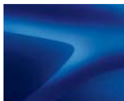
BLEU IRON (2)