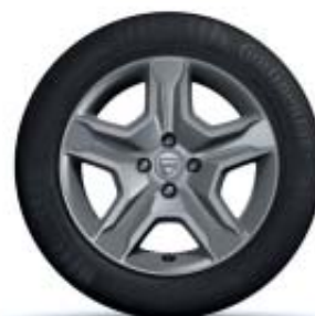
JANTES DESIGN 16" BAYADÈRE DARK METAL**