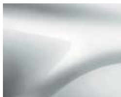
BLANC GLACIER (1)