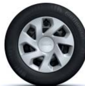
ENJOLIVEUR 15" GROOMY*